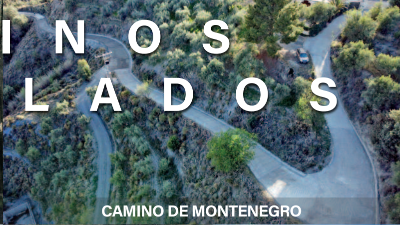
CAMINO DE MONTENEGRO