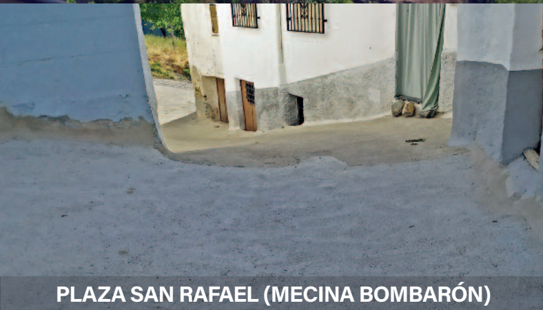
PLAZA SAN RAFAEL (MECINA BOMBARÓN)