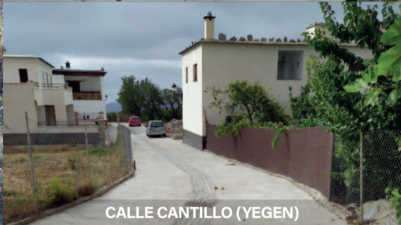
CALLE CANTILLO (YEGEN)