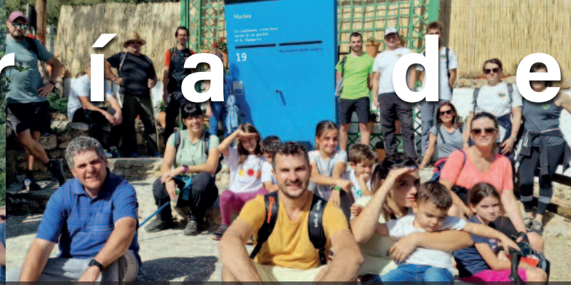
JORNADA DE SENDERISMO POR LOS CASTAÑOS EN EL PUENTE DE TODOS LOS SANTOS