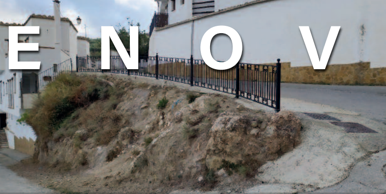
AVENIDA DE ANDALUCÍA (EL GOLCO)