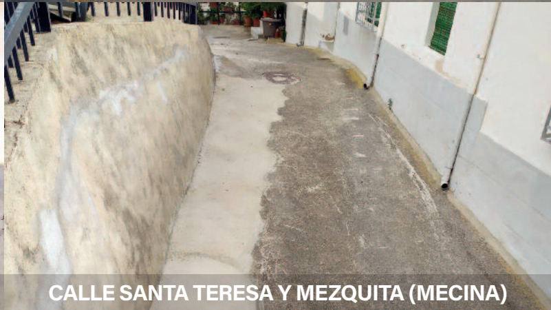
CALLE SANTA TERESA Y MEZQUITA (MECINA)