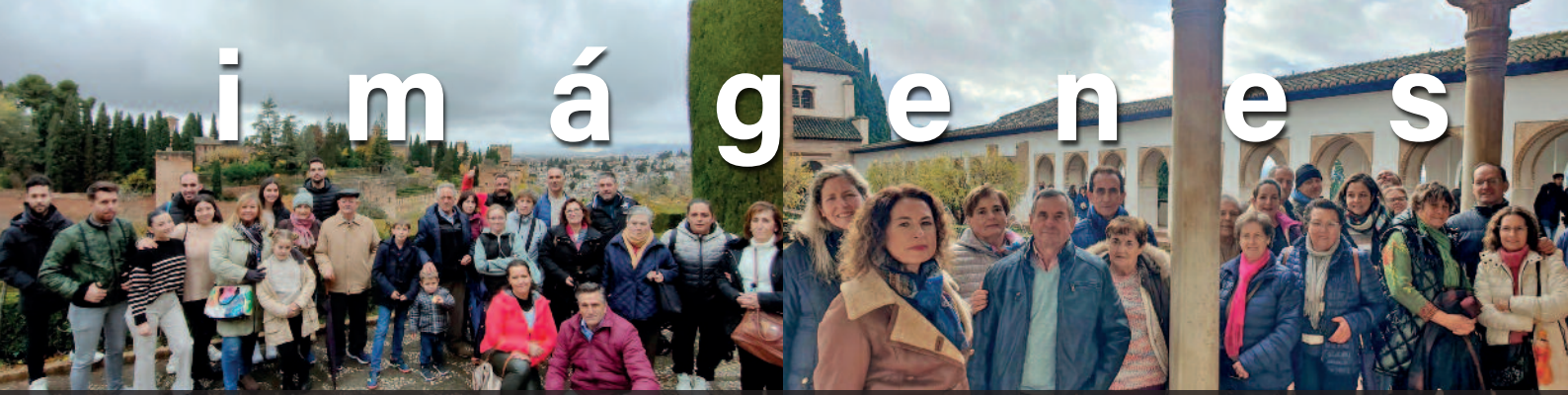
VIAJE A LA ALHAMBRA