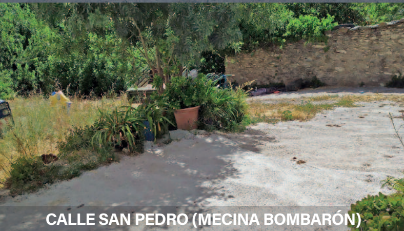
CALLE SAN PEDRO (MECINA BOMBARÓN)