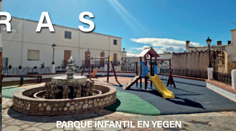
PARQUE INFANTIL EN YEGEN