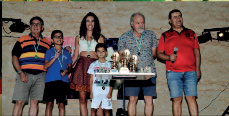
FIN DE SEMANA CULTURAL EN EL GOLCO