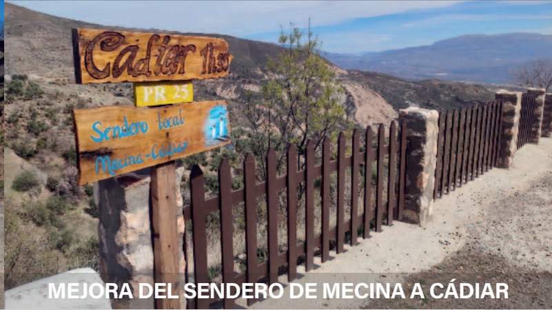
MEJORA DEL SENDERO DE MECINA A CÁDIAR