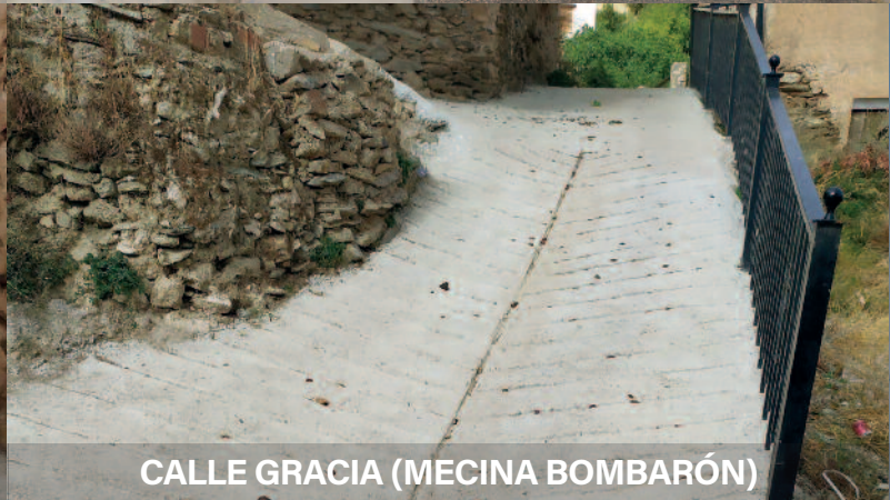
CALLE GRACIA (MECINA BOMBARÓN)