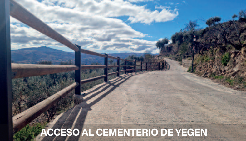
ACCESO AL CEMENTERIO DE YEGEN