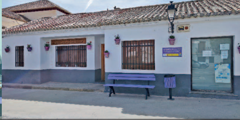
BANCO CONTRA LA VIOLENCIA DE GÉNERO EN YEGEN