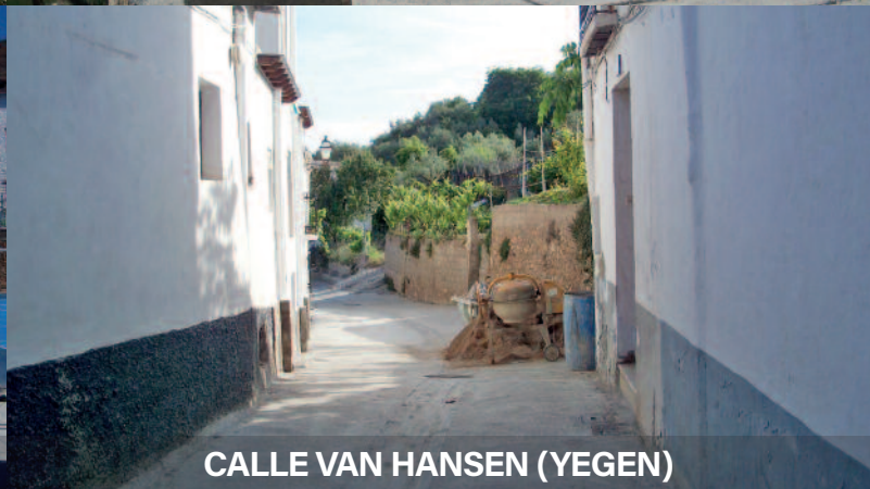
CALLE VAN HANSEN (YEGEN)