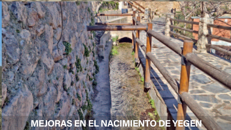
MEJORAS EN EL NACIMIENTO DE YEGEN