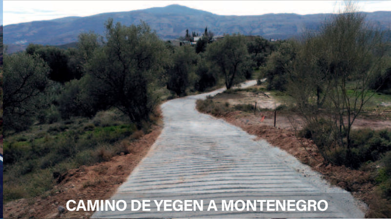
CAMINO DE YEGEN A MONTENEGRO