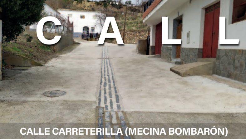
CALLE CARRETERILLA (MECINA BOMBARÓN)