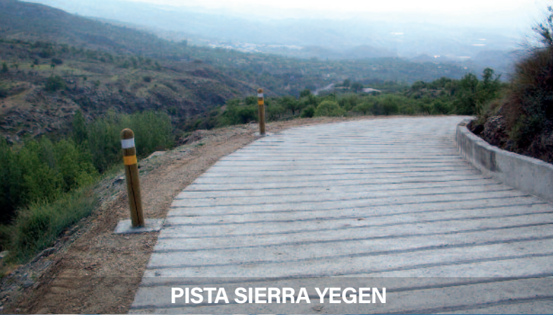
PISTA SIERRA YEGEN