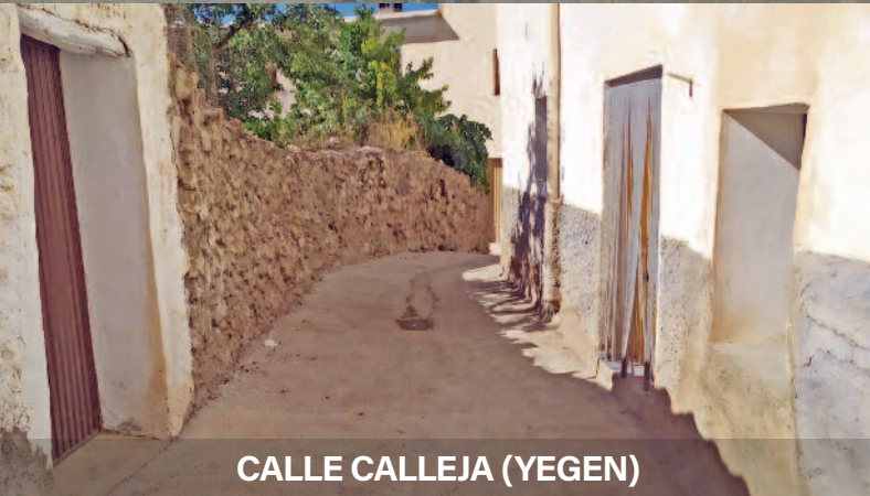
CALLE CALLEJA (YEGEN)