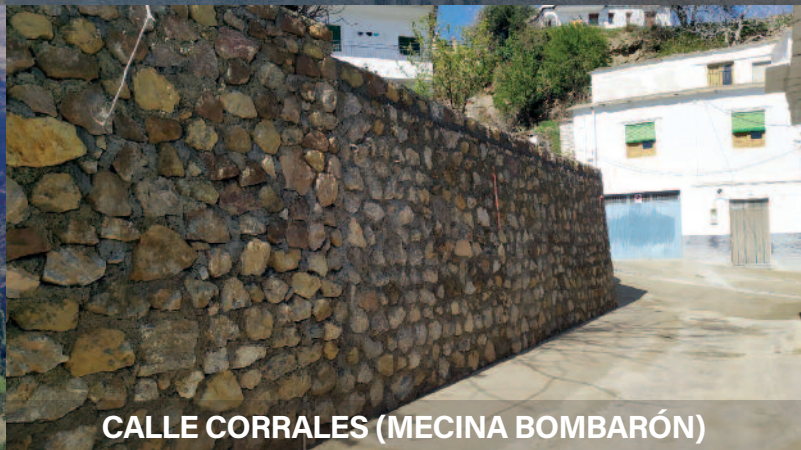
CALLE CORRALES (MECINA BOMBARÓN)