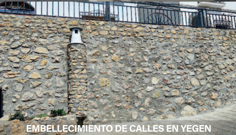
EMBELLECIMIENTO DE CALLES EN YEGEN