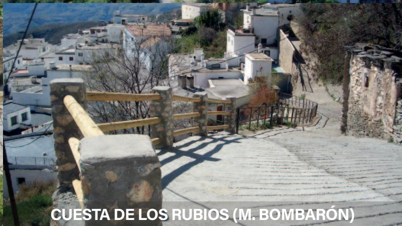
CUESTA DE LOS RUBIOS (M. BOMBARÓN)