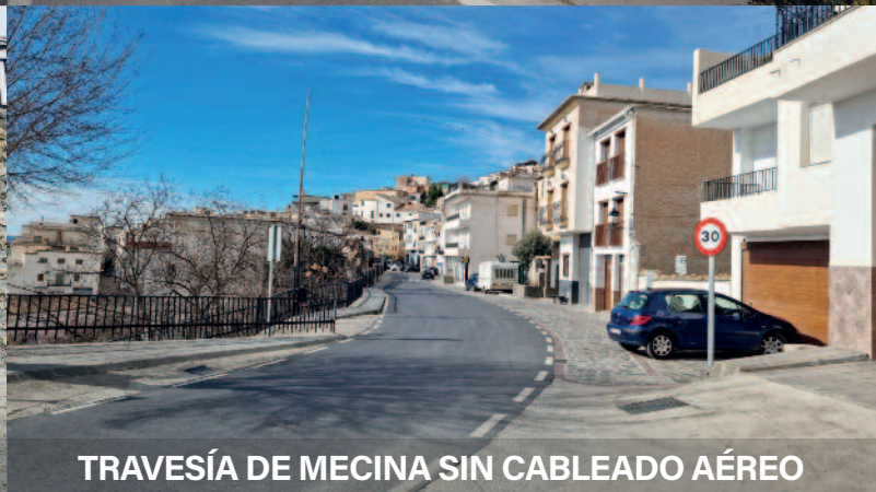
TRAVESÍA DE MECINA SIN CABLEADO AÉREO