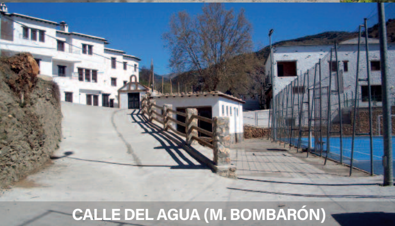
CALLE DEL AGUA (M. BOMBARÓN)