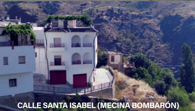
CALLE SANTA ISABEL (MECINA BOMBARÓN)