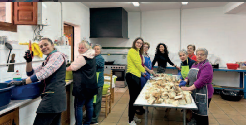
CARNAVAL 2023 EN YEGEN