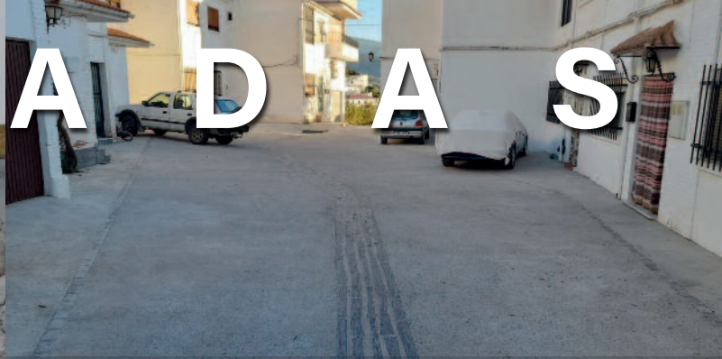
PLAZA PICULINA (YEGEN)