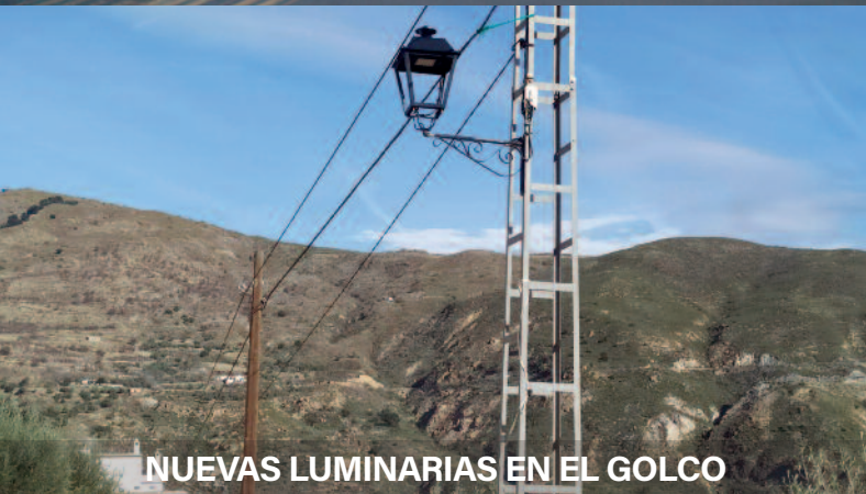
NUEVAS LUMINARIAS EN EL GOLCO