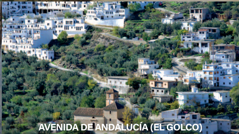
AVENIDA DE ANDALUCÍA (EL GOLCO)