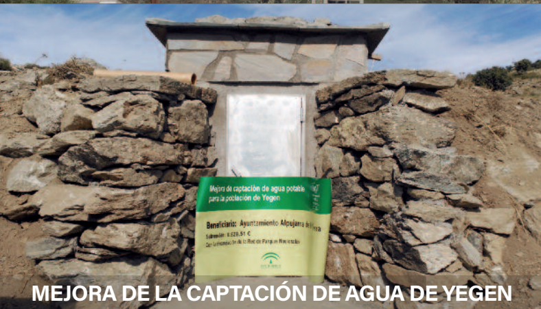
MEJORA DE LA CAPTACIÓN DE AGUA DE YEGEN