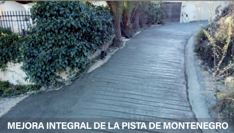
MEJORA INTEGRAL DE LA PISTA DE MONTENEGRO