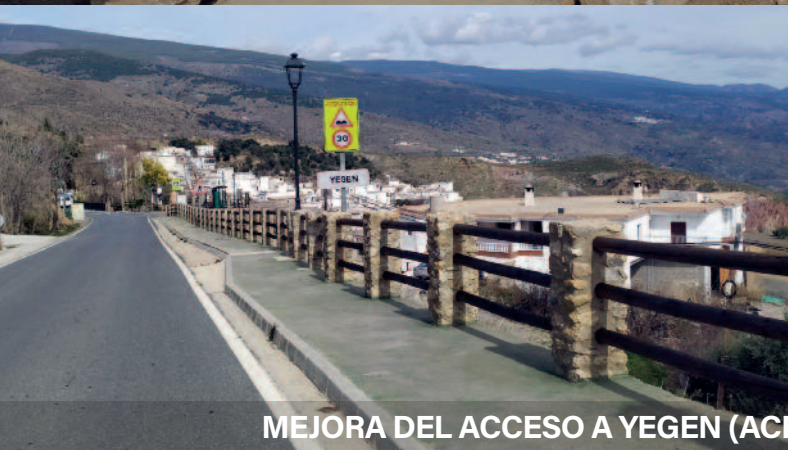
MEJORA DEL ACCESO A YEGEN (ACERADO, ZONA DEL PUENTE Y PASEO)