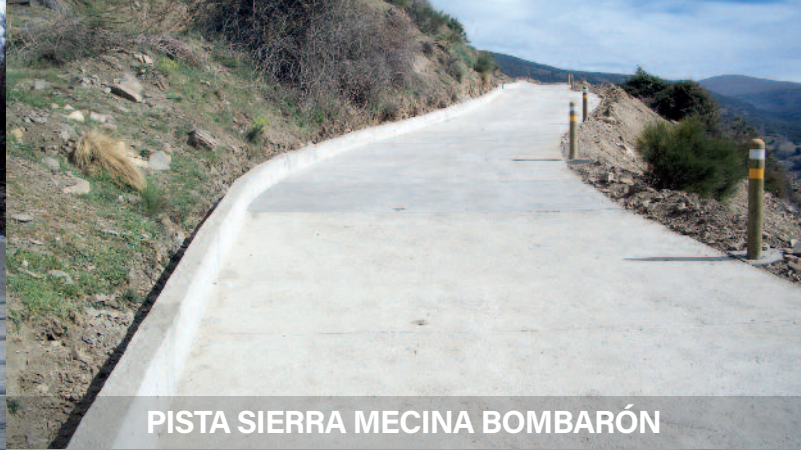
PISTA SIERRA MECINA BOMBARÓN