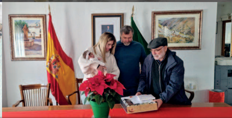
LOS VECINOS DE MÁS Y MENOS EDAD RECIBEN SU REGALO DE REYES DE MANOS DEL ALCALDE