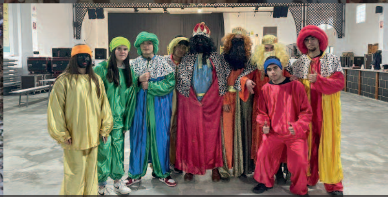
CABALGATA DE REYES EN MECINA BOMBARÓN Y EN YEGEN