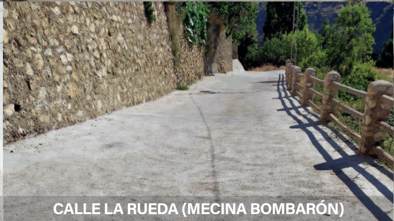
CALLE LA RUEDA (MECINA BOMBARÓN)