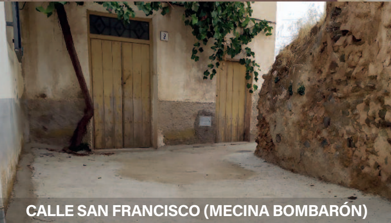
CALLE SAN FRANCISCO (MECINA BOMBARÓN)