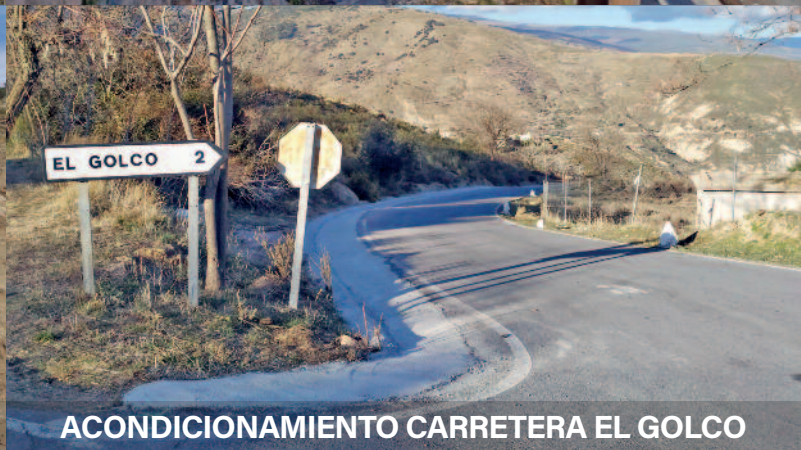
ACONDICIONAMIENTO CARRETERA EL GOLCO