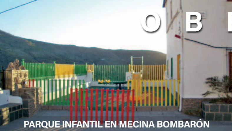
PARQUE INFANTIL EN MECINA BOMBARÓN