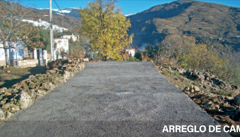
ARREGLO DE CAMINOS VECINALES