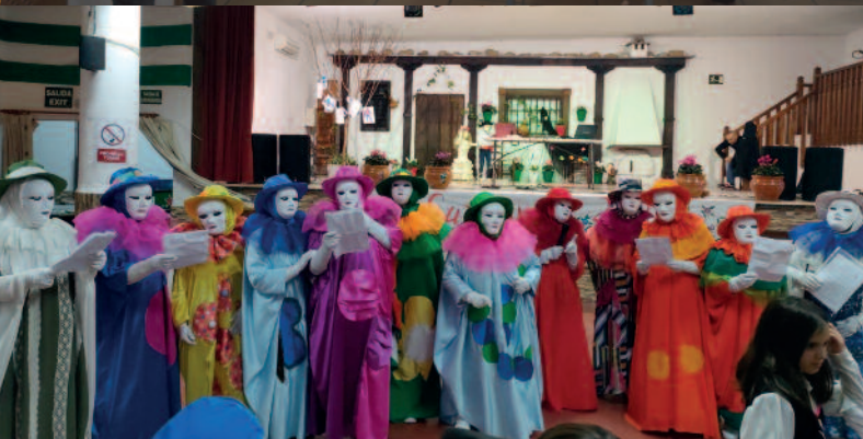
CELEBRACIÓN DEL CARNAVAL EN MECINA BOMBARÓN