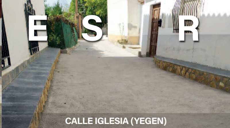
CALLE IGLESIA (YEGEN)