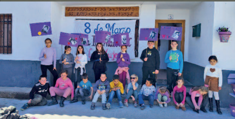
CELEBRACIÓN DEL 8 DE MARZO, DÍA INTERNACIONAL DE LAS MUJERES