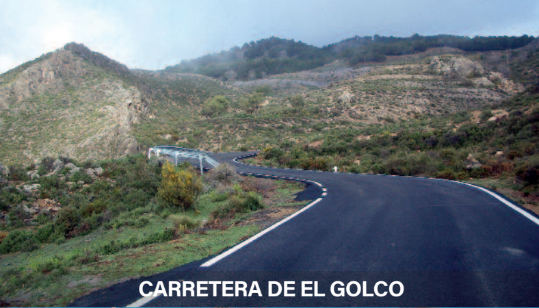
CARRETERA DE EL GOLCO