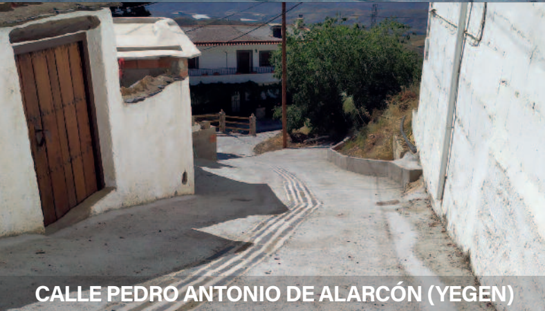
CALLE PEDRO ANTONIO DE ALARCÓN (YEGEN)