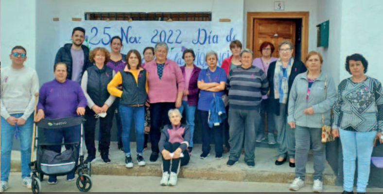
CONTRA LA VIOLENCIA DE GÉNERO